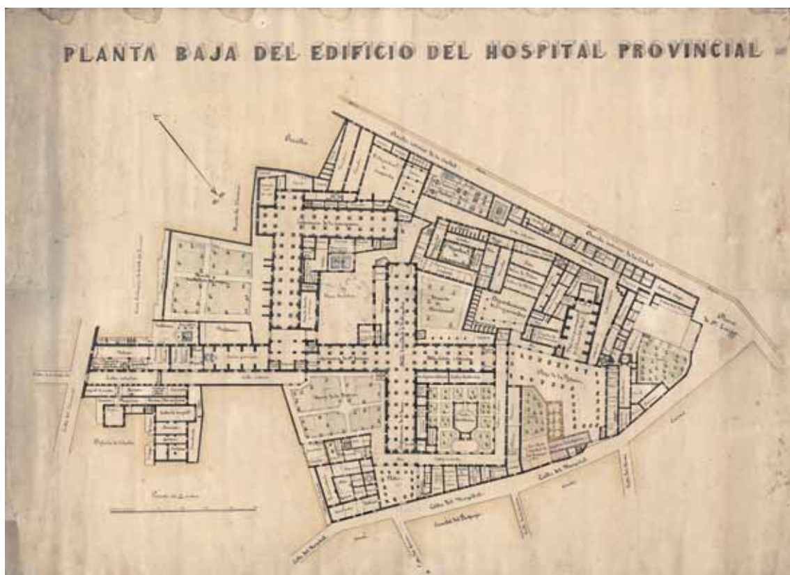
Fig. 1. Plànol Hospital, s. XIX (MuVIM).

posterior reglament de 14 de maig de 1852, la corporació va assumir les competències de beneficència. En conseqüència, passaven a la Diputació com a establiments provincials de beneficència la Casa de la Misericòrdia, la Casa de la Beneficència i l'Hospital General, amb les seues institucions depenents: Teatre Principal i Plaça de Bous de València.